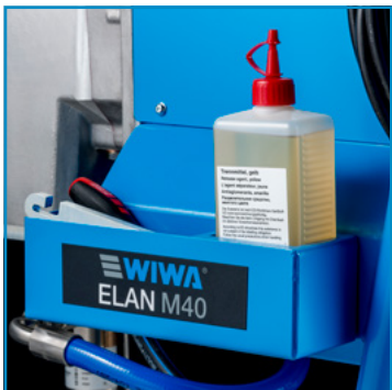
Caixa de armazenamento prática