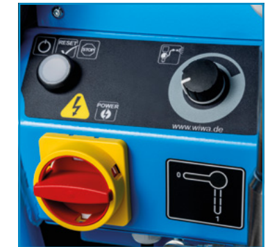
사용자 친화적인 제어