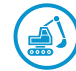
건축 및 토목 공사