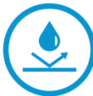
Protection des bâtiments