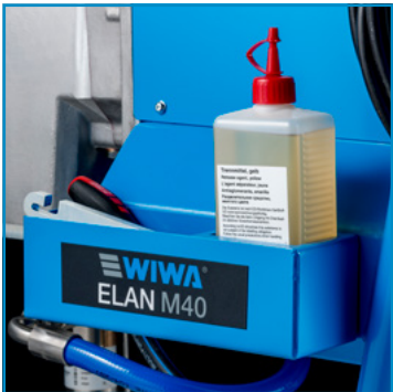
Boîte de rangement pratique