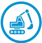
Génie civil et bâtiment